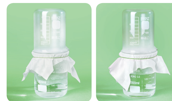
优可丝纤柔无纺布

优可丝®纤柔纤维制成的无纺布更轻薄均匀，湿水状态如隐形般与肌肤完美贴合，通透舒适，水分直达肌底，而其制作的面膜基布极其顺滑服贴。